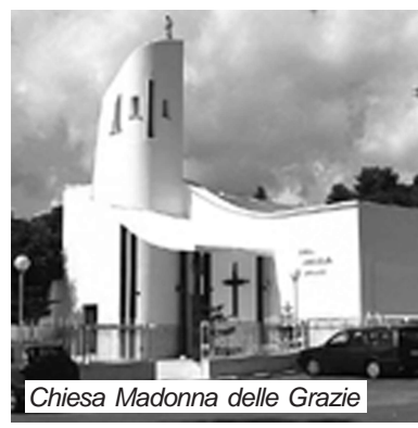
Chiesa Madonna delle Grazie