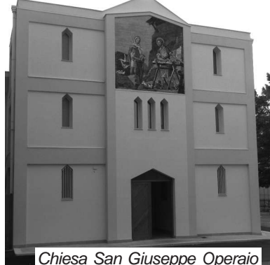
Chiesa San Giuseppe Operaio